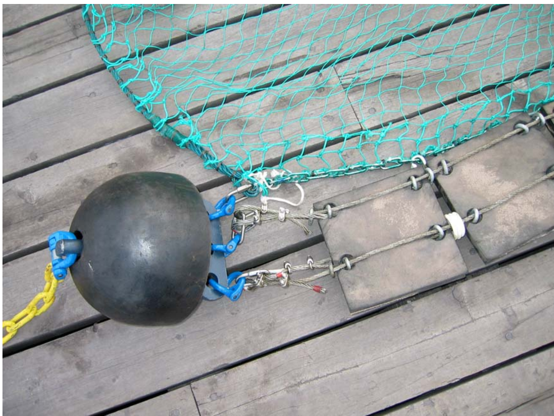
Figur 2. Plater av gummi